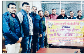
रोहताक। अपनी मांगों के लिए विरोध प्रदर्शन करते हुए पेंशन बहाली संघर्ष समिति के सदस्य।