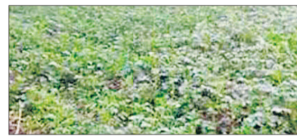
यमुनानगर। घना कोहरा पड़ने से प्रभावित हुई आलू की फसल।

आसमान में दिन भर धुंध के बादल छाए रहने और सुबह के वक्त घना कोहरा छाए रहने की वजह से