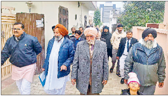
कुरुक्षेत्र। गांव का निरीक्षण करते स्वच्छ भारत मिशन हरियाणा के वाइस चेयरमैन सुभाष चंद्र।

दिए गए थे लेकिन दोनों मोबाइल नंबर 9 डिजिट के हैं। ये मोबाइल नंबर 899985446 व 899985447 बताए गए हैं। रिपोर्ट में ये नंबर जानबूझकर तो नहीं दिए गए इस पर अब 12 जनवरी को सुनवाई होगी।